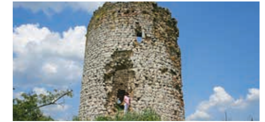
16세기부터 유래하는 페루시치 옛 마을의 유적.