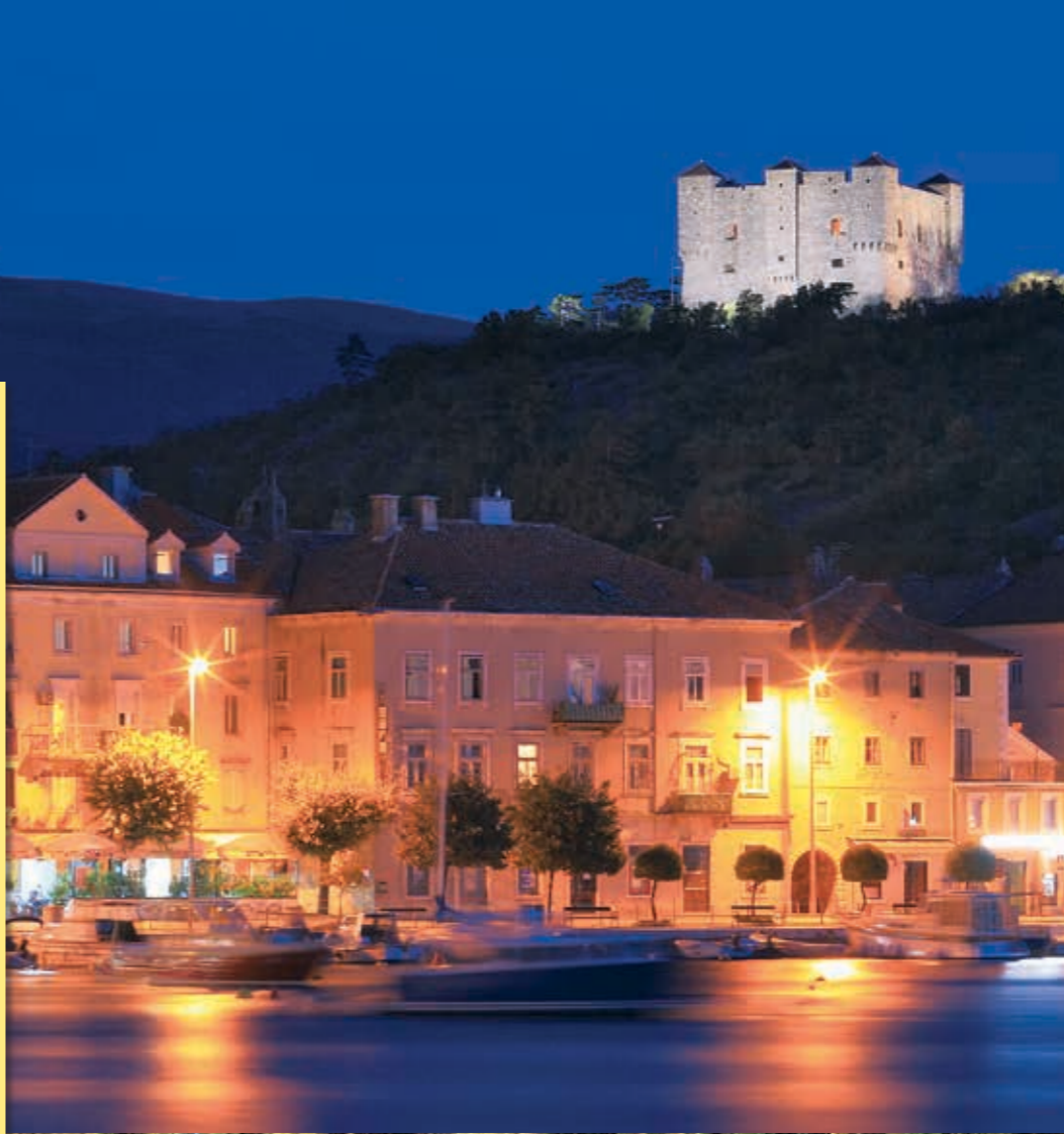
위 사진: 크리보푸트 로드의 생이 아래 사진: 네하이 요새

가는 방법 생이에 가려면 주타 로크바의 A1 고속도로 출구 9에서 나오십시오. 추천 명소 - 생이의 네하이 요새 외에, 부카소비치 가문의 궁전에 있는 시립 박물관과 7월 15일부터 9월 1일까지 방문자에게 공개되는 성례 예술의 상설 전시관을 방문해 보십시오. - 세인트 메리 교회, 생이의 선원과 어부의 봉헌 교회 - 1100년경 글라골 문자로 새긴 생이의 현판 유물 - 칠니차 기념 광장 - 조세핀 로드의 끝인 생이시 입구의 그레이트 게이트 - 우스콧스카 거리, 웅장하고 잘 보존된 대표적 중세 건축물 - 생이시 북부의 위도 45도에 있는 아드리아 고속도로 상에 만든 해시계 생이의 주변 자브라트니차는 벨레빗의 기슭에 있는 자연적 카르스트 현상입니다. 위치는 라브 섬으로 가는 아블라나츠 페리 선착장 남쪽 2.5km에 있습니다. 협곡은 길이가 약 900m, 폭은 50~150m입니다. 베이 위에 우뚝 솟은 크라스니차 언덕에서 선사 유적이 발견되었습니다. 다이빙이 특별히 좋아할 만한 곳은 수심 8~10m 깊이에 2차 세계 대전 때 침몰한 독일 선박입니다. 가는 방법 자브라트니차는 아블라나츠에서 보트 또는 도보 트레일로 접근하실 수 있습니다. 이벤트 - 스페티 유라이 - 자비장, 울타리 - 자비장 사이 클링 대회: 6월 21일 - 네하이 요새가 구축된 시기에서 유래한 이벤트 및 풍습을 재현하는 "데이즈 어브 더 우스콧스" 표현 행사: 7월 11일~13일 - 국제 생이 여름 카니발: 8월 초 - 생이 뮤지컬 썸머: 8월 - 생이 - 삼바스티초: 삼바 축제, 생이 삼바 주간: 7월