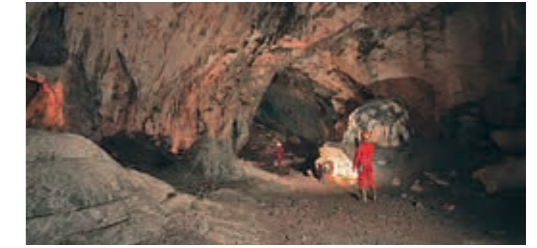
사모그라드 동굴, 그라보바차 동굴 공원