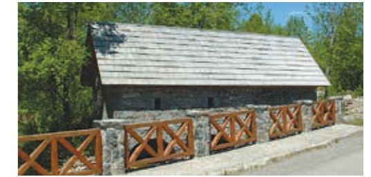
트라비치 로빈의 밀