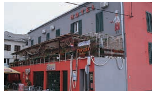
벨리나츠 호텔(유스 호스텔) 카를로박, 1 트룩 dr. 프란에 투츠만야 전화: +385 (0) 53 694-008 www.hotel-velinac.hr

발 호텔(시즌에만 영업), 카를로박, 블라디미라 나조라 13, 이메일: hostel.val@hep.hr