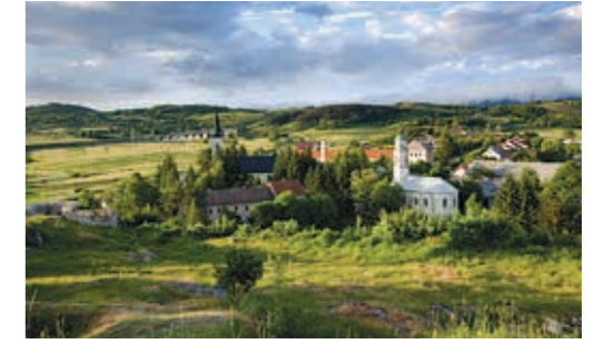
소콜라츠 마을에서 본 브링예