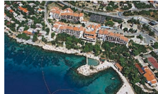
자그레브 호텔 *** 카를로박, 나젤에 바나 J. 엘나치차 b.b. 전화: +385 (0)53 694-777 (시즌에만 운영)