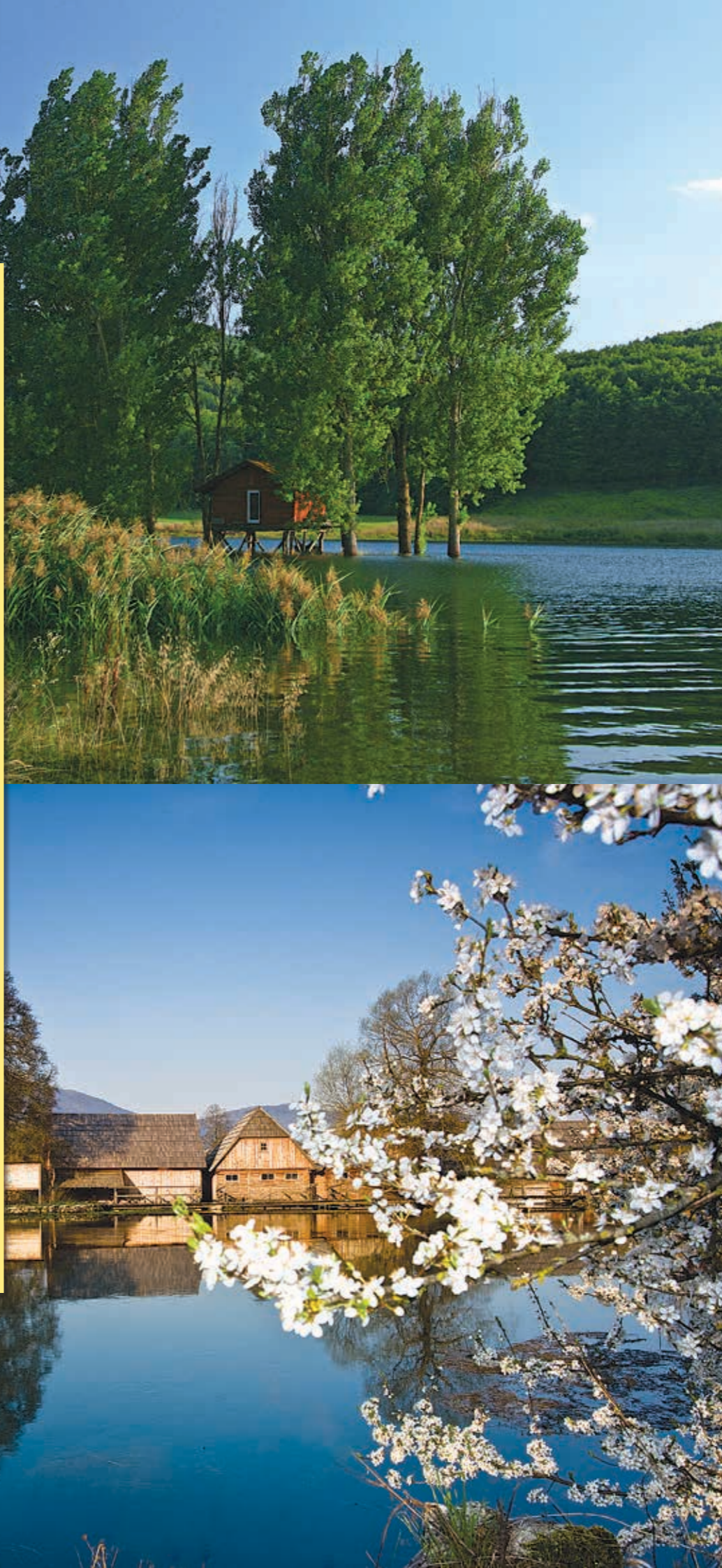
아래 사진: 가스카 강