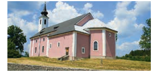
17세기부터 유래하는 성 십자가의 교회는 페루시치에서 클라나츠까지의 도로에 있습니다.