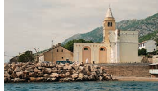
세인트 카를로 보로메이스키 교회 유적(1710년).