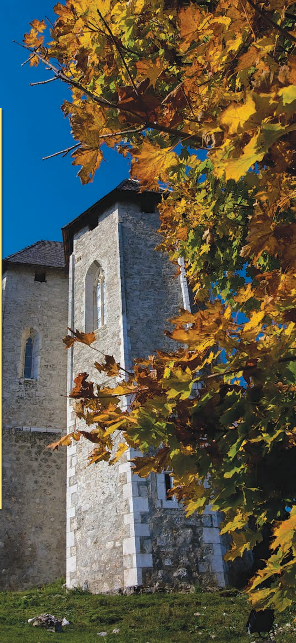
브링예 - 소콜라츠