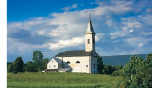
나사스차 교회sv.크리자 1820, 크리즈폴예