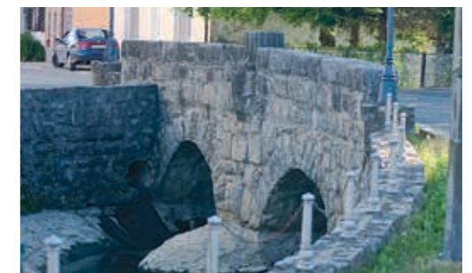
가테 야루가를 가로지르는 석조 다리(1801년 축조)