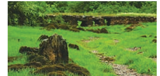
수바야를 지나는 스톤 크로스